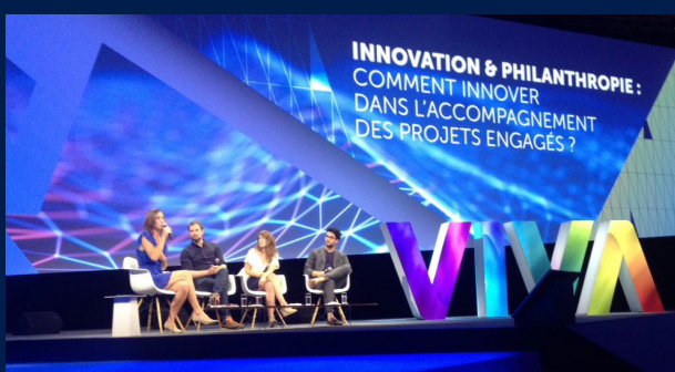
17 juin 2017 - Lancement de ShareIT sur VivaTechnology.

Le choix de l'écosystème STATION F est tout sauf un hasard pour Ashoka, qui défend depuis plus de 35 ans les vertus du décroissement et de la co-création, pour répondre aux problématiques sociales majeures. Au sein du plus grand campus d'entrepreneurs au monde, Ashoka souhaite faire la démonstration qu'il existe parmi les startups tech des solutions et des compétences dans lesquelles résident quelques unes des réponses aux grands enjeux sociétaux de notre époque. Les 1000 startups présentes à STATION F sont toutes des entreprises sociales en puissance : à ShareIT de révéler le potentiel social de chacune, en créant des synergies avec les entrepreneurs sociaux les plus innovants.