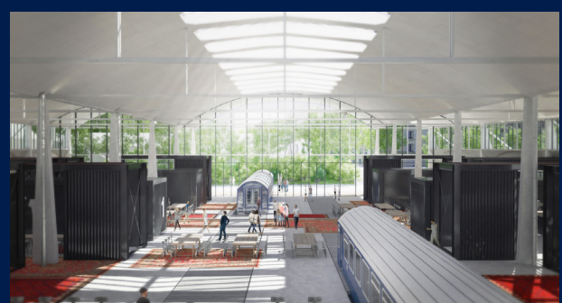
4 juillet 2017 - Installation de ShareIT à Station F.